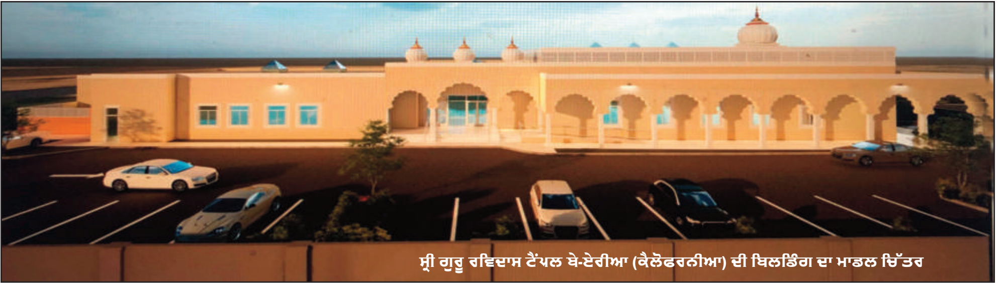
ਸ੍ਰੀ ਗੁਰੂ ਰਵਿਦਾਸ ਟੈਂਪਲ ਬੇ-ਏਰੀਆ (ਕੈਲੇਫੋਰਨੀਆ) ਦੀ ਬਿਲਡਿੰਗ ਦਾ ਮਾਡਲ ਚਿੱਤਰ